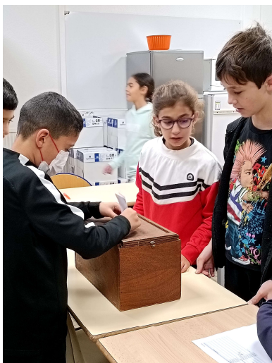
Vote sous l'œil attentif du président du « bureau de vote » à l'école Jean-Rostand

Le jour J, la Ville met à disposition de chaque école participante tout le matériel nécessaire, afin que les enfants soient mis en situation réelle d'élection : bulletins de vote, isolements, urnes, liste d'émargement... Ils seront un peu plus de 700, ce jeudi 8 décembre, à s'exprimer. Le vote se fait à bulletin secret.