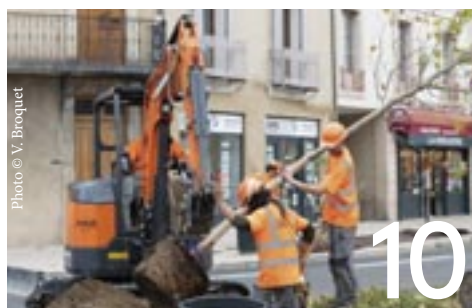
Les plantations cours Pierre-Didier