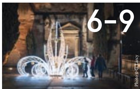
Tour d'horizon des animations de Noël