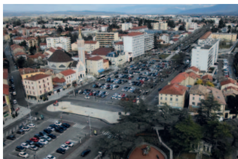
Vue actuelle de la place Jean-Jaurès