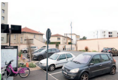
Le parking Duchesne offre 73 places longues durées.