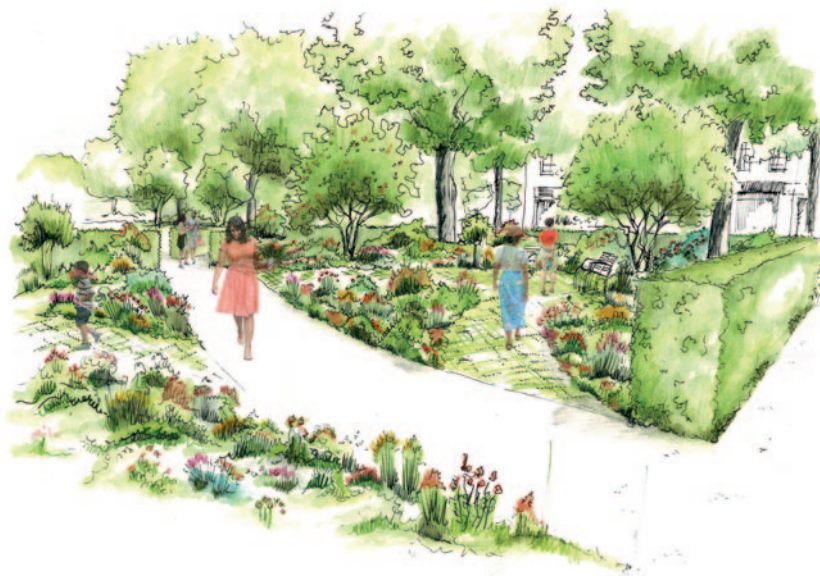
Illustration du projet

nouvelle dynamique d'attractivité tant commerciale que résidentielle. À terme, le projet d'aménagement permettra de créer environ 9 500 m 2 d'espaces verts en cœur de ville (contre 460 m 2 aujourd'hui) et 300 arbres et arbustes - adaptés au climat local et résistants aux fortes chaleurs - prendront place sur la promenade et s'ajouteront aux 97 existants.