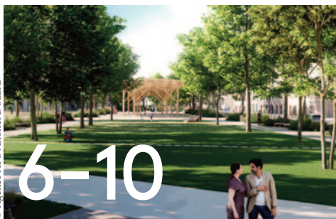
Zoom sur le projet Jean-Jaurès