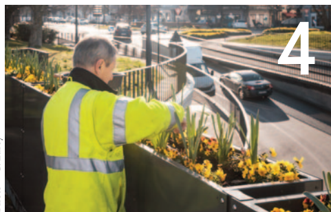
Les espaces verts et espaces fleuris

Votre magazine est distribué dans toutes les boîtes aux lettres romaines portant ou non un stop pub. La distribution est effectuée par du personnel en insertion de la société Archer sur 5 jours en moyenne. Si vous ne le recevez pas, vous pouvez le signaler au service communication au 04 75 05 55 37. Sur ville-romans.fr vous pouvez lire le contenu de chaque numéro dès sa parution.