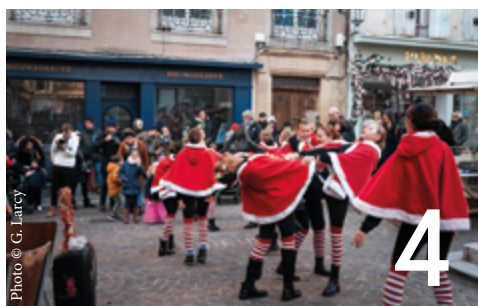
La magie de Noël