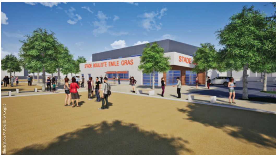
Illustration © Abeille & Cogne

Le nouveau stade bouliste Émile-Gras sera inauguré au printemps 2024.