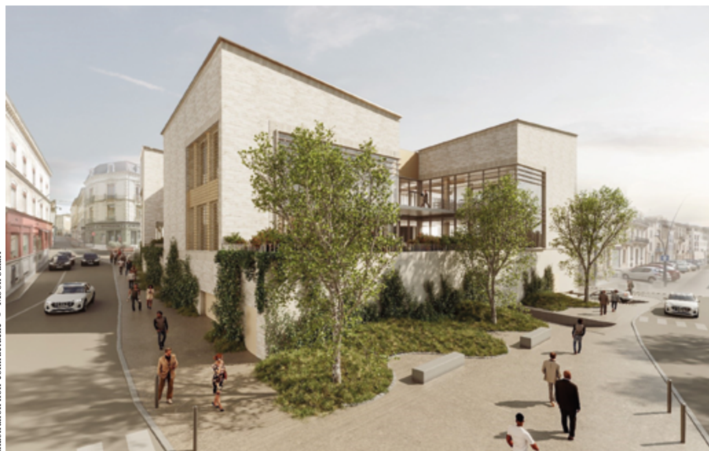
Vue depuis les quais.

Sur le site de Fanal, un nouveau bâtiment va voir le jour. Il accueillera, notamment, la médiathèque Simone-de-Beauvoir. Dévoilé le 13 décembre dernier, en conseil communautaire, ce projet ambitieux restructure complètement la médiathèque pour l'adapter aux attentes du public.