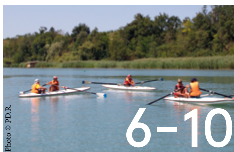
Tour d'horizon des projets sportifs 2024