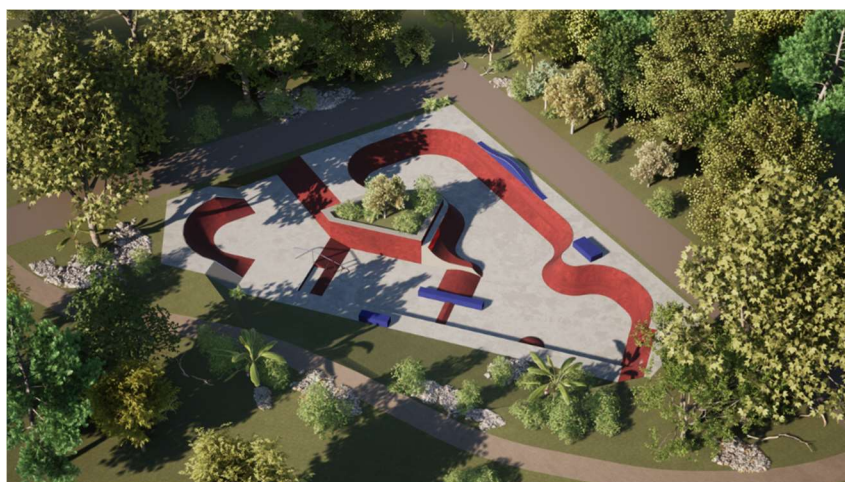
Le futur Skate Park - Illustration non-contractuelle - ©Hurricane

De son côté, l'aire de jeux devrait être installée pour la mi-mai. Les toilettes le sont déjà, mais ne sont pas encore raccordées à l'électricité.