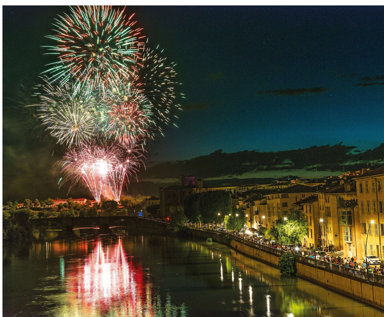
Le feu d'artifice sera tiré à 22h15 -- Ville de Romans