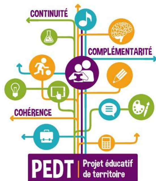
Illustration non contractuelle

Ces échanges ont abouti, notamment, sur deux chartes de partenariat, approuvées en conseil municipal: l'une relative à la continuité éducative et l'autre concernant la mise à disposition des Atsem (Agent territorial spécialisé des écoles maternelles).