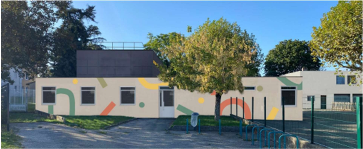
Les Arnauds - Phase 2

Il s'agit, pour cette école de la 2 e phase de rénovation, après celle de 2023, avec la poursuite de la réhabilitation thermique sur le bâtiment « Alpes » (notamment isolation par l'extérieur et changement des menuiseries) avec, également, la création d'un nouvel espace polyvalent de 55 m 2 qui sera mutualisé avec l'école et le centre de loisirs municipal dédié aux plus de 6 ans.